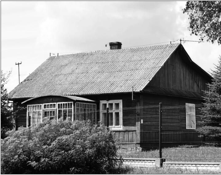
Ryc. 243. Drewniany budynek dawnej szkoły w Rabinówce, widok z 2019 roku.