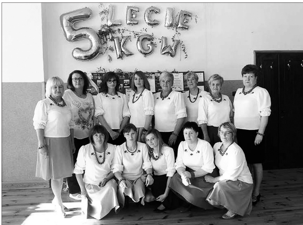
Ryc. 251. Koło Gospodyń Wiejskich z Rabinówki, fot. ze zb. GOK w Podhorcach.