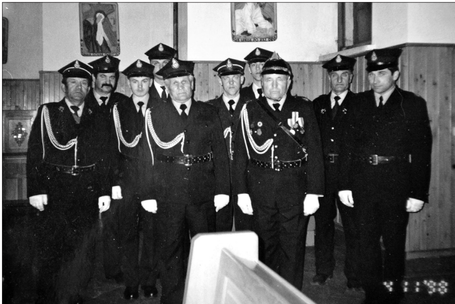
Ryc. 250. Straż pożarna z Rabinówki w 1998 roku, fot. ze zb. A. Kłosa.

dycyjną recepturę. Drugą gałęzią produkcji piekarni jest wyrób ciastek. Wyroby dystrybuowane są do sklepów na terenie miasta i gminy Tomaszów Lubelski. Prowadzona jest także sprzedaż z samochodów przez powstałą w 2017 roku firmę „Polskie Sklepy” należącą do braci Sławomira i Krzysztofa Palaków 656 .