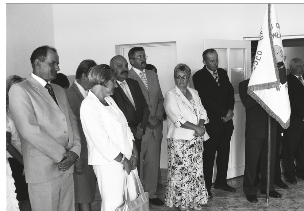
Ryc. 100. Uroczystości nadania imienia oraz sztandaru szkole w Honiatyczach w 2008 roku, fot. ze zbiorów A. Emerle.